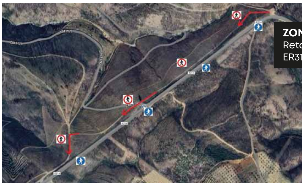
ZONA ESPETÁCULO Reta de Mascanho ER314

Saindo de Murça direcção Chaves – Valpaços – Carrazedo pela R 314, chegará à Z.E. entre o Km 37 e o Km 36,2 desta estrada na famosa recta de Mascanho. (entre as coordenadas N 41° 27.177' - W 07° 27.782' e as N 41° 27.548 – W 07° 27.113').