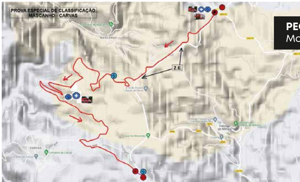
PEC 2, 5 e 7 Mascanho - Carvas