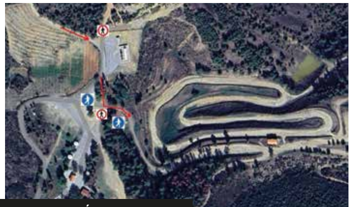
ZONA ESPETÁCULO 1 ER314